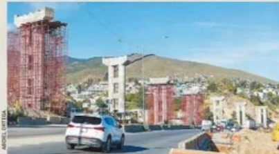
Pilotes del viaducto de acceso desde el bulevar Limón Padilla a Otay II.

En la conferencia 'Mañanera', el militar a cargo de la obra detalló al Presidente de la República los avances de esa y otras dos construcciones que se realizan en Tijuana